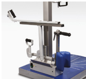
Dynatorq: set leve standard