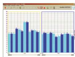
Esercizio dinamico Grafici a confronto

Software intuitivo con impostazioni facilitate e sequenze guidate.